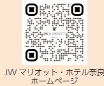
JW マリオット・ホテル奈良 ホームページ

オリアナシェフコラボレーションストロベリースイーツビュッフェ 1月18日(土)～5月6日(火) 世界のラグジュアリーホテルで活躍するペストリーシェフ・オリアナと当ホテルのイスラムによる特別なコラボレーション。濃厚な味わいの古都華をはじめ、奈良県産いちごを使った25種類のスイーツ&セイボリー、25種類のノンアルコールドリンクが華やかに彩ります。フランスの伝統菓子に柚子、抹茶、桜など日本のエッセンスを加えた新しい味わいをご堪能ください。注目はフランスの伝統菓子「ミニサントノーレ」。シュー生地にかaramelクリームやいちごを乗せました。ライブステーションではいちごのグラニテが登場。特性ペストソースが引き立てる爽やかな味わいをお試しください。